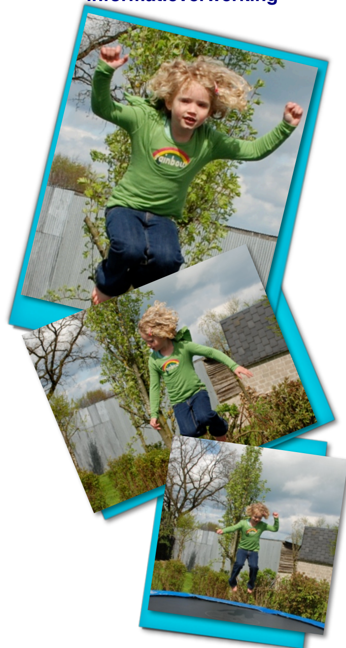
Folder voor ouders